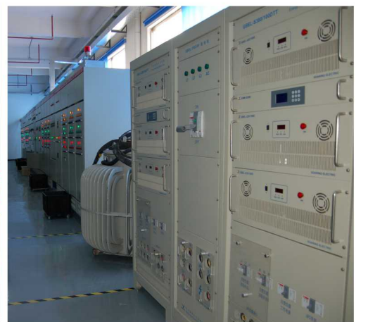
2000KW电子负载设备及老化平台 交流智能微电网研发实验