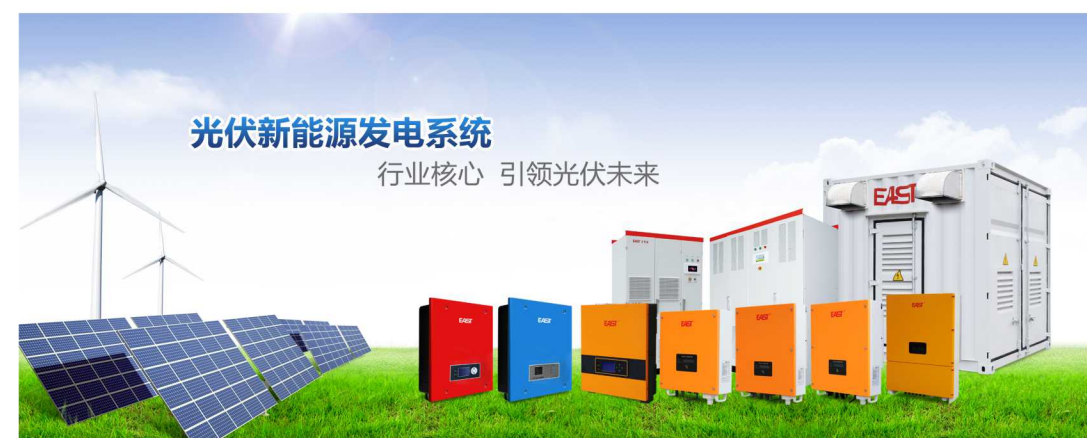
光伏新能源发电系统 行业核心 引领光伏未来

智慧城市&大数据(系统集成)、智慧能源(光伏发电、储能、充电桩和智能电网)、轨道交通(监控、通信和供电)