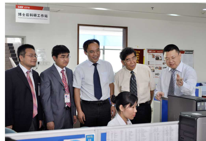
中国科学院钱清泉院士(右二)在指导我司轨道交通研发工作

调南方之水,聚核能之电,织高铁路网,架跨海大桥,在一系列事关国计民生的重大项目、重大工程、重大创新中,知识产权为实体经济发展提供了重要支撑。易事特是其中一些项目的参与者,也是历史发展的见证者,易事特将持续创新,锐意进取,充分发挥在行业中的示范引领作用,推动行业在知识产权的建设工作中不断进步。