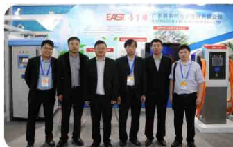
易事特参加深圳高交会,展出系列充电产品