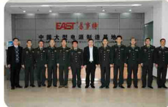
总装备部装备承制单位资格审查组一行,莅临公司现场审查和指导工作