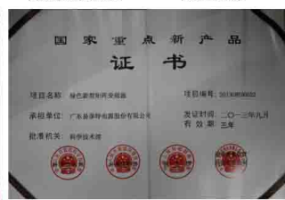
易事特绿色新型矩阵变频器获评为国家重点新产品证书