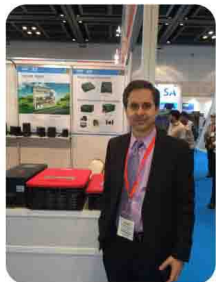
客商参观易事特公司展馆,易事特品牌产品惊艳亮相中东太阳能光伏展