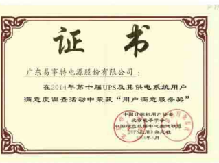
第十届UPS“用户满意服务奖”