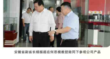
安徽省副省长杨振超在何思模教授陪同下参观公司产品