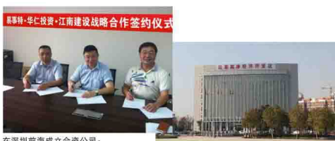
在深圳前海成立合资公司: 易事特与华仁投资、江南建设签订战略合作协议

联盟宗旨: 以应用为导向、以产业为主线、以技术为核心, 以创新为动力, 凝聚联盟内各成员的发展共识, 整合优质资源, 积极开展新能源汽车产业技术交流和发展的模式创新, 推动政府制定有利于产业发展的重大政策, 提升联盟成员的群体竞争力, 推动东莞市乃至广东省的新能源汽车产业健康快速发展。