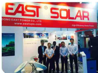
易事特参加印度光伏展会