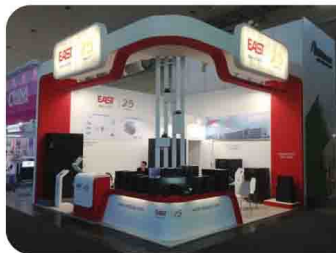
易事特自主研发新品在德国CEBIT展亮相

2014年,易事特的名字叫的最响亮。中东国际太阳能光伏展,德国CEBIT展, SNEC(2014)光伏展,2014印度国际可再生能源展览会,中国进出口商品交易会,中国国际高新技术成果交易会,2014中国(东莞)国际科技合作周。展会上,更多易事特自主研发的新品被认识、认可,越来越多的易事特产品冲出亚洲,走向世界。不懈追求,金石为开,因为我们相信,易事特可以服务全世界。