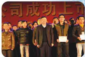
2014年易事特新春联欢晚会