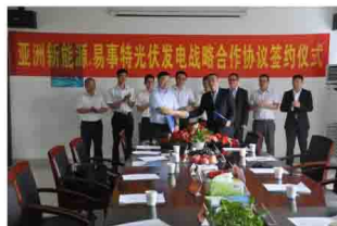
亚洲新能源签订战略合作协议。

2014年, 易事特完成了历史性跨越的第一步, 成功在深交所上市, 公司发展步入了一个全新的征程。公司紧抓第三次工业革命和大数据时代机遇, 牵头成立了广东东莞新能源汽车产业技术联盟并当选主席单位, 全力拓展新能源汽车产业; 先后同十一院、亚洲新能源、南方电网、东台市政府、商洛市政府、江苏高淳经开区、开普检测等签订战略合作协议, 并在全国各地投资成立了10余家子公司, 全面负责战略合作业务的落地, 为公司未来的持续发展奠定了坚实的基础。