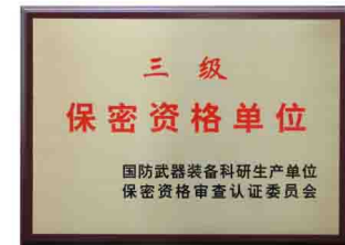
三级保密资格单位