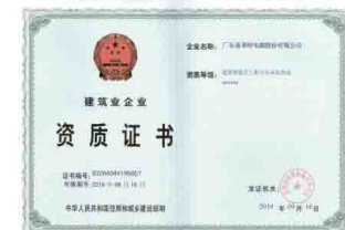
建筑业企业资质证书 建筑智能化工程专业承包三级