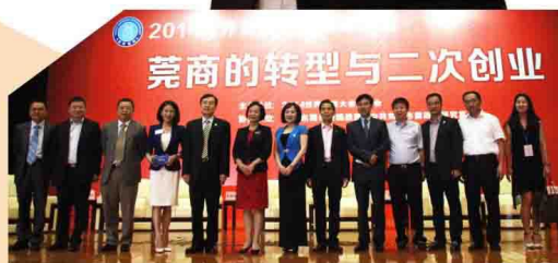
莞商大会: 张科常务副市长与何思模教授共话莞商企业转型升级