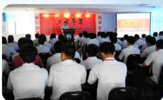
百余名新入企大学生争当“易事特将军”