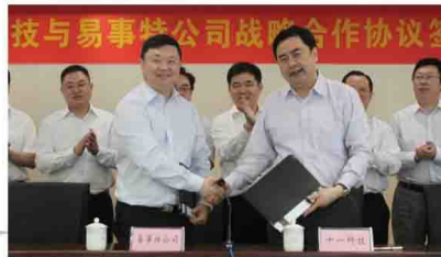
同中国电子十一院签订战略合作协议

2014年, 易事特完成了历史性跨越的第一步, 成功在深交所上市, 公司发展步入了一个全新的征程。公司紧抓第三次工业革命和大数据时代机遇, 牵头成立了广东东莞新能源汽车产业技术联盟并当选主席单位, 全力拓展新能源汽车产业; 先后同十一院、亚洲新能源、南方电网、东台市政府、商洛市政府、江苏高淳经开区、开普检测等签订战略合作协议, 并在全国各地投资成立了10余家子公司, 全面负责战略合作业务的落地, 为公司未来的持续发展奠定了坚实的基础。