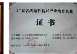
广东省战略性新兴产业培育企业证书