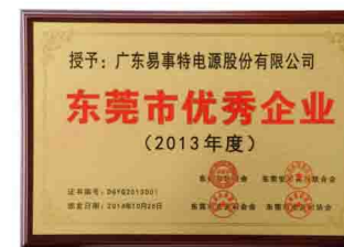
2013年度东莞市优秀企业