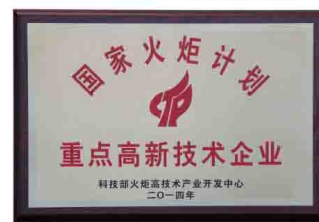
国家火炬计划重点高新技术企业