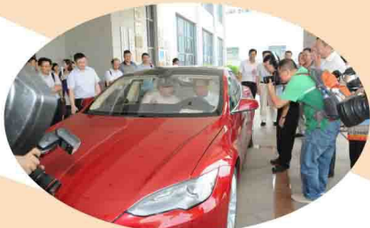
李敏全主席率团调研我司新能源汽车产业发展情况