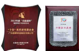
荣获“北极星杯” 十佳光伏逆变器企业