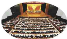
董事长何思模教授出席两会并发出东莞经济增长“好声音”