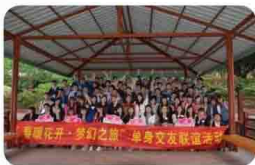
松山湖单身青年联谊活动现场(松山湖管委会、易事特、生益科技、漫步者、天宏、宇龙酷派、北部医院等)