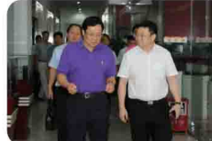
新疆图木舒克市长毕小彬率团考察易事特新能源产业