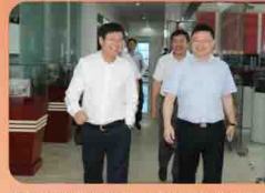
宁夏中卫徐力群市长一行莅临易事特考察调研