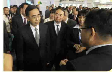
董事长何思模教授向朱小丹省长、周济院长等领导介绍联盟产业发展