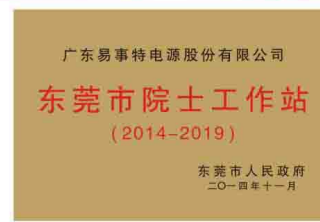
东莞市院士工作站