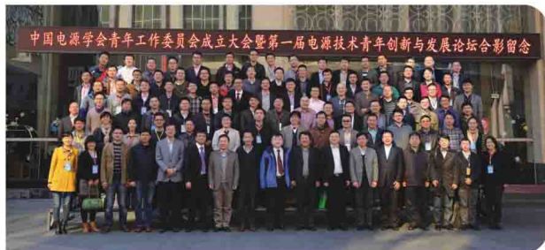
易事特承办中国电源学会青年工作委员会成立大会暨第一届电源技术青年创新与发展论坛