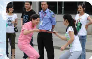
2014年举办趣味运动会