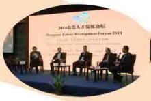
董事长何思模教授为东莞人才发展建言献策