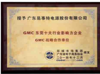
GMC东莞十大行业影响力企业