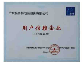
2014年度用户信赖企业