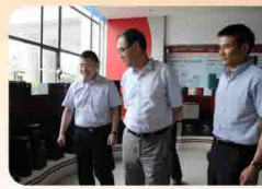
安徽六安市委书记毕小彬率团考察易事特