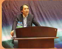
民建中央副主席辜胜阻出席研讨会并作主题演讲