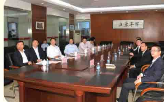
东台市委书记张礼祥一行莅临易事特考察调研