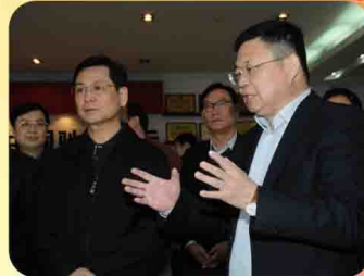
陈云贤副省长与何思模教授亲密同行