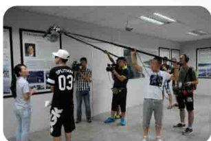
《舞动全城》节目摄制组了解易事特创新发展情况