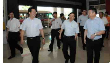
济宁市市长杨永红、济宁市委常委、副市长周洪、济宁市副市长白山在东莞市副市长贺宇和东莞松山湖管委会常务副主任董康的陪同下考察易事特