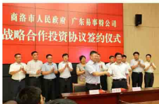
同商洛市人民政府签订战略合作协议: 陈俊市长等领导嘉宾见证董事长何思模教授与常务副市长张荣珠签约