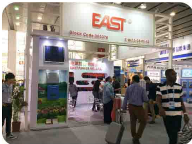
易事特广交会品牌展位