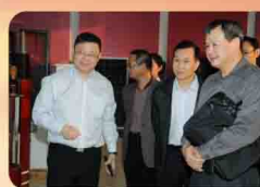
广东省委第二巡视组领导参观易事特展厅